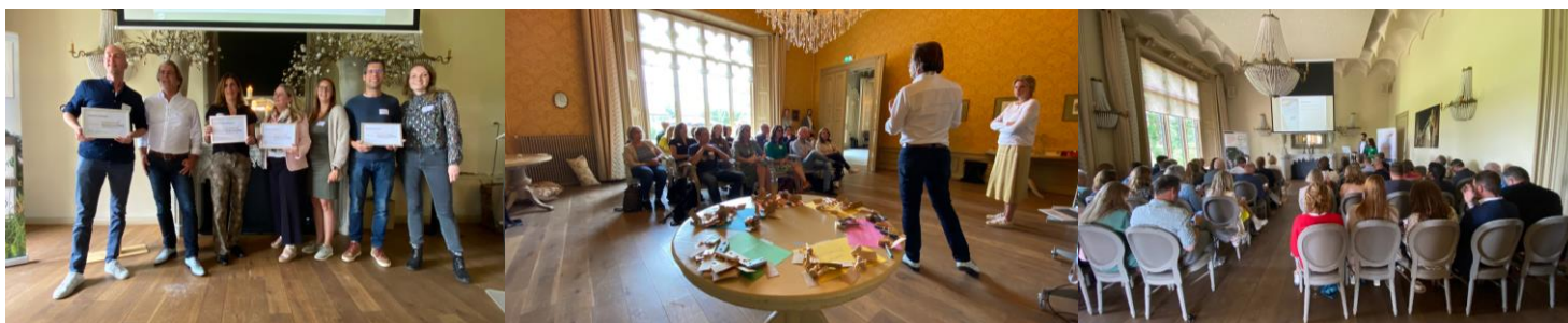
Uitreiking sterren van Kwaliteitsmonitor fietsregio's tijdens netwerkmiddag in Kasteel Schaffelaar in Barneveld

In een vernieuwde Kwaliteitsmonitor zijn tien provincies op vier hoofdonderdelen beoordeeld. Van infrastructuur tot bewegwijzering en van vindbaarheid routeinformatie tot provinciaal fietsbeleid. De monitor had een gewijzigde opzet. Extra aandacht ging naar veilig en aantrekkelijk kunnen fietsen. En de stem van de fietser telde zwaarder. Vier provincies scoorden 4½ ster: Friesland, Drenthe, Zeeland en Noord-Brabant. Groningen, Limburg en Utrecht ontvingen 4 sterren, Flevoland 3½, Noord-Holland 3 en Zuid-Holland 2½ ster. In december verscheen het rapport met toelichting en aanbevelingen.