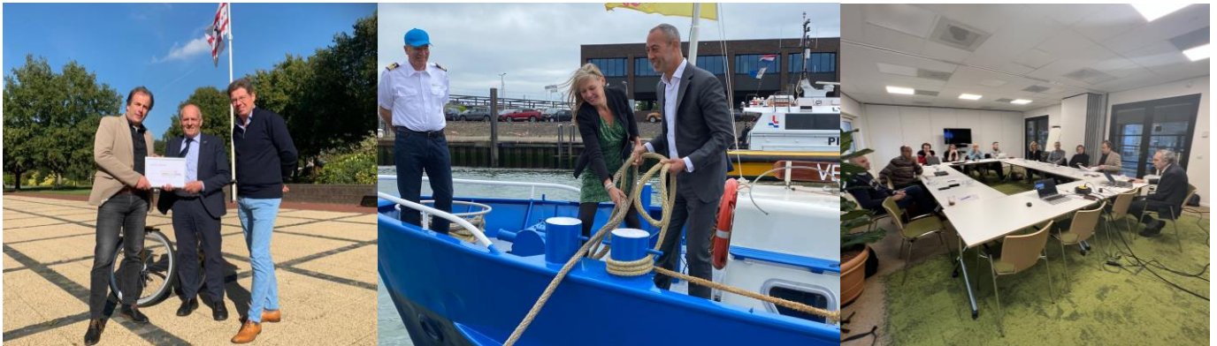
Een greep uit de activiteiten: werkbezoek Drenthe, opening veer Hoek van Holland en bijeenkomst Fietsen in de natuur